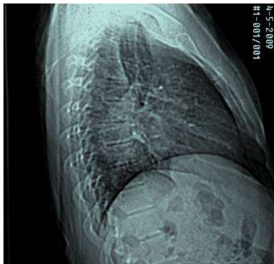
Fig.1: Rx Columna dorsal lateral derecha

Se realiza estudio radiológico (Rx) de columna dorsal antero-posterior (AP) y lateral derecha, (Fig. 1) informándose como opacidad retrocardiaca, prevertebral, aspecto de masa, por lo que se le realiza tomografía computarizada (TC) de tórax, simple (SP) y contrastado endovenoso (EV) (Fig. 2), para evaluar mediastino, constatándose imagen quística del mediastino posterior paraesofágica y paravertebral derecha, de paredes finas regulares que realzan a la administración del contraste. Por todo lo anterior se le realizó Biopsia por Aspiración con Aguja Fina (BAAF) de la lesión que resultó no útil. Se decide exploración quirúrgica por toracotomía derecha vía axilar (Fig. 3), confirmándose la presencia de lesión quística del mediastino posterior y se realiza exéresis de la tumoración. Obteniéndose el resultado anatomopatológico de quiste enterogénico.