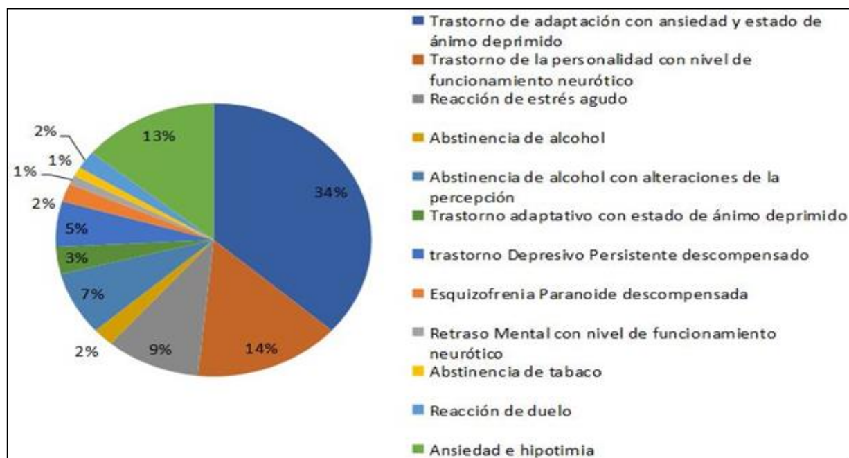
Gráfico 2. Distribución porcentual de los pacientes quemados según la presencia de trastorno mental durante la hospitalización

El nivel de escolaridad se asoció de forma significativa al trastorno mental durante la hospitalización ( \chi^2=9.155 ; p<0.05 ), así como las variables convivencia ( \chi^2=5.879 ; p<0.05 ) y antecedentes psicopatológicos personales ( \chi^2=8.128 ; p<0.05 ), también se relacionaron a trastorno mental durante la hospitalización.